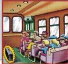
Взрывные устройства террористов могут быть замаскированы под самые обычные предметы: чемодан, сумку, пакет, свёрток, коробку, игрушку и т.п.

Любой бесхозный предмет, обнаруженный в общественном месте, может представлять опасность.