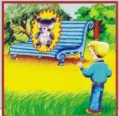
Их могут установить в урнах, под скамейками, в транспорте, на лестничной площадке, в любых общественных местах.